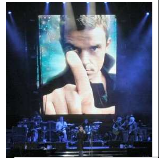
Fig: Pantalla 4 x 3 mts con 27,600 pixels